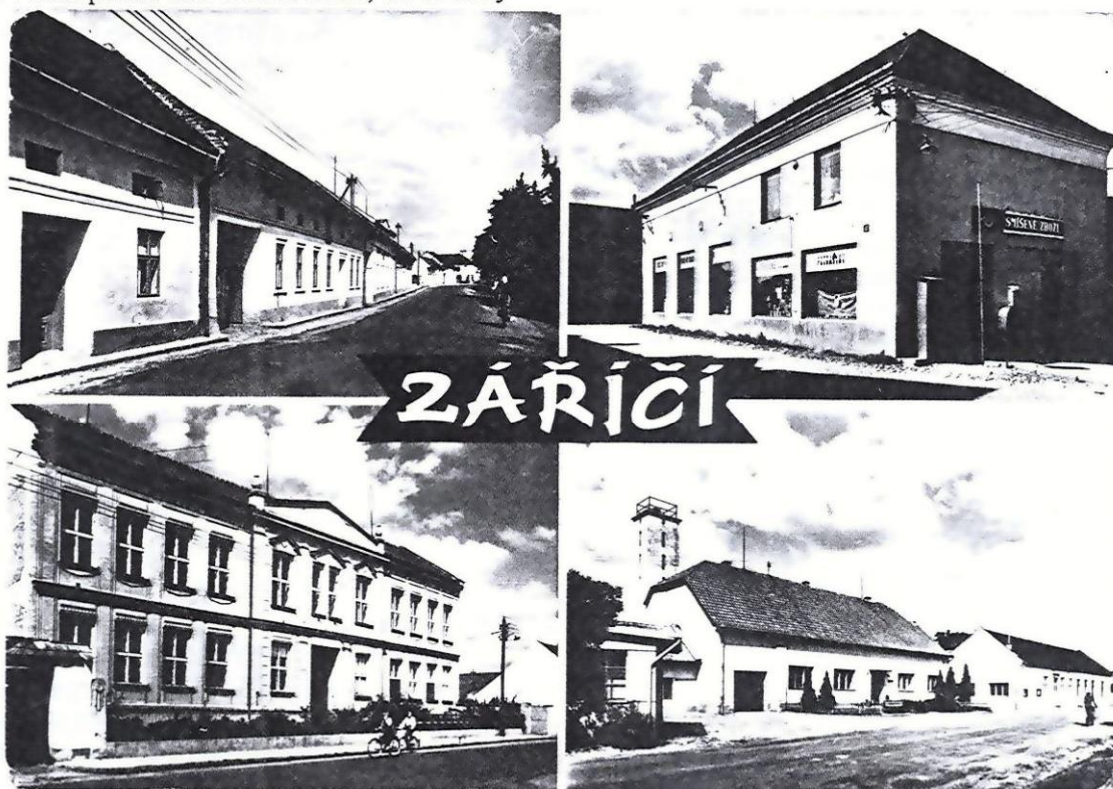
Zářičský občasník č. 1